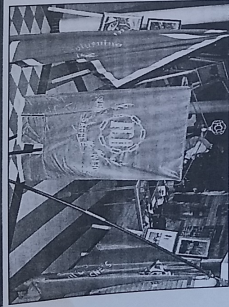
Exempel på vacker arbetsmarknad under konferensen.

Politiken måste ändras för att kunna hantera den moderna arbetsmarknaden. Detta innebär att stärka utbildningsväsendet och att förbättra arbetsmarknadsförhållandena. Arbetsmarknadsförhållandena har förändrats radikalt, och arbetsgivarna måste anpassa sig till dessa förändringar.