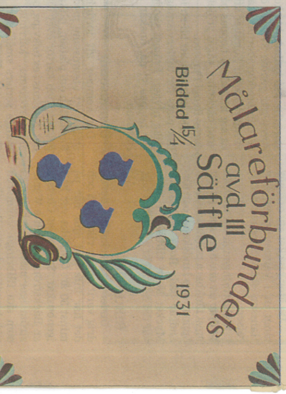
Målarna i Säfte lade ned stor möda på att utforma sin symbol. Avdelningen bildades 15 april 1931.