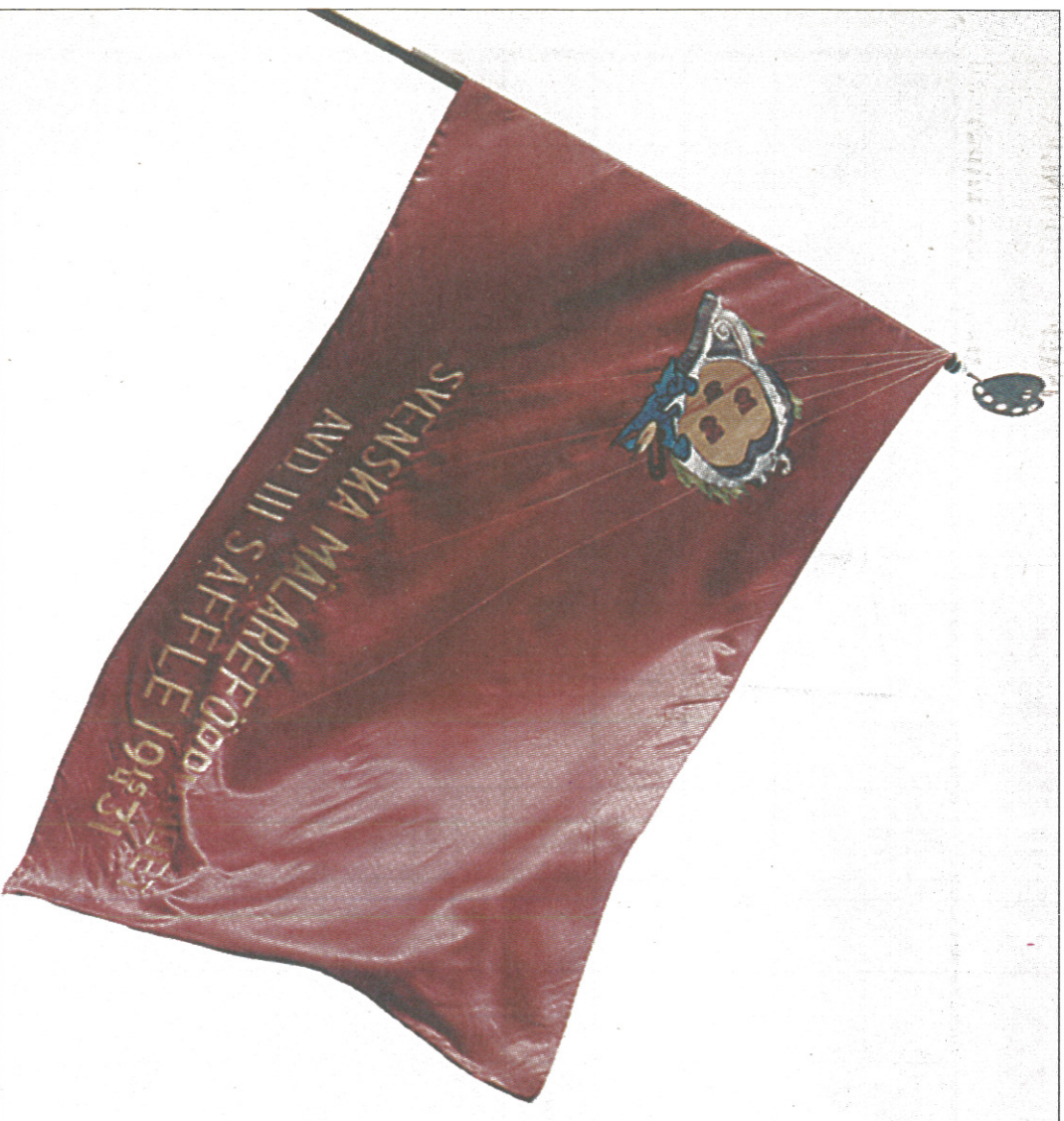
Det var vågat att ha röda fanor när de började tillverkas i slutet av 1800-talet. Så gjordes de också för att fackföreningarna ville visa upp sig. Den här fanan beställdes av Mälarförbundet i Säffle avdelning 111.